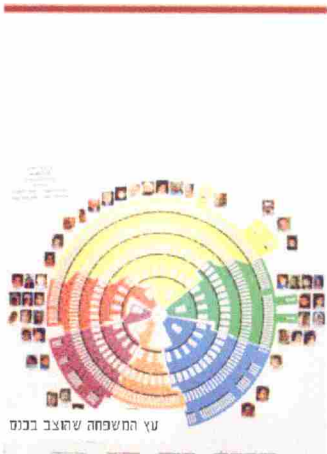
עץ המשפחה שחוצב בכנס באירוע נכחו כ-300 איש.