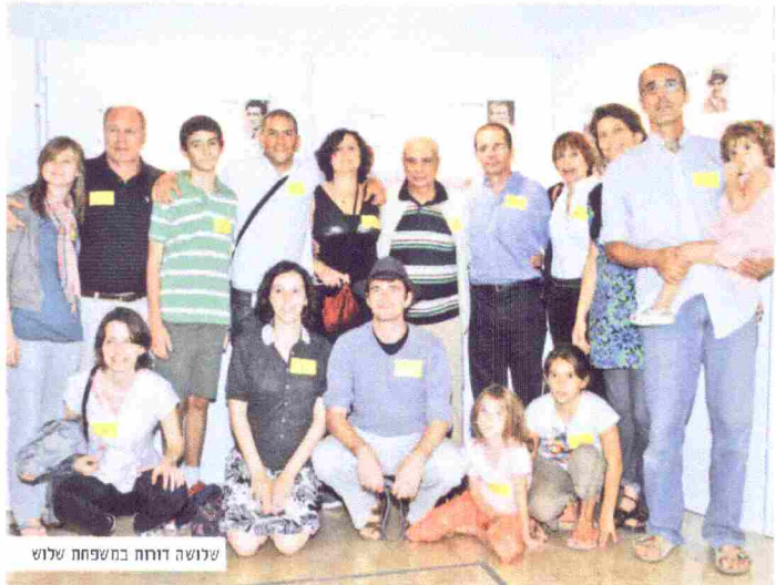
שלושה דוחה במשפחה שלוש